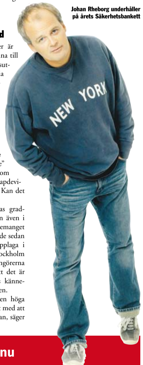
Johan Rheborg underhåller på årets Säkerhetsbankett

Förregistrera dig för gratis entré – www.sectech.nu