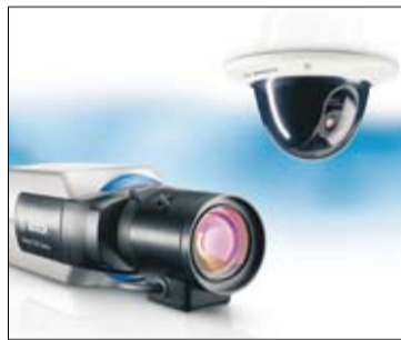
Dinion2X: Andra generationen Dinion-kameror med 20-bitars processor.

Bosch Security Systems ser en ökning i användandet av intelligent videoanalys. Idag används IVA i ett flertal av alla kameraanläggningar som säljs och fler och fler upptäcker nyttan med denna intelligens. Kamerorna själva möjliggör en fullt automatiserad videoövervakning där olika anläggningsspecifika kriterier, då de skall larma, kan specificeras.